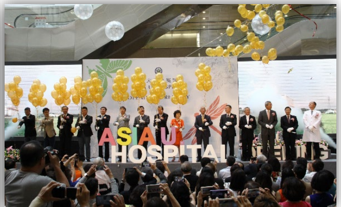
圖：亞洲大學附屬醫院