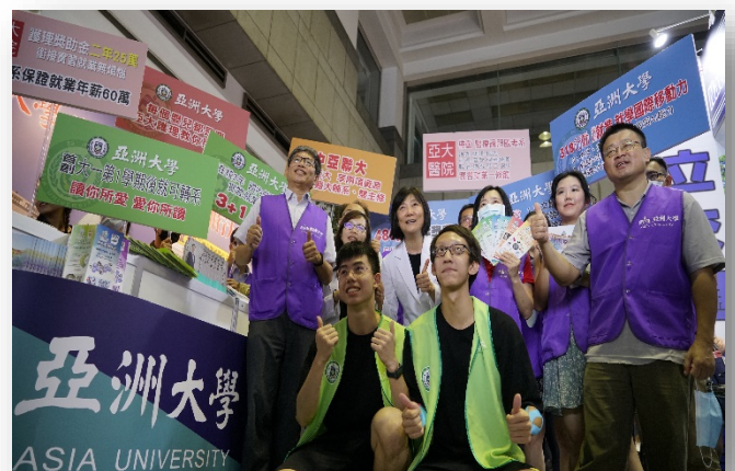
圖：招生處行政團隊參加大學博覽會