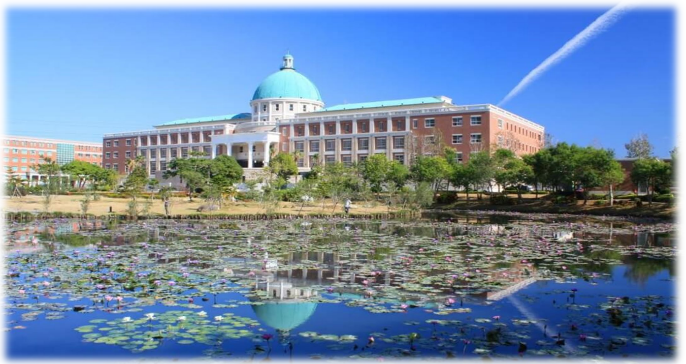
圖：就讀亞大，宛如就讀一所「綜合大學」+「醫學大學」+「國際大學」